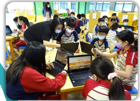
來實作查找及判別資料吧！