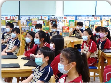
六年級孩子們認真聽課。