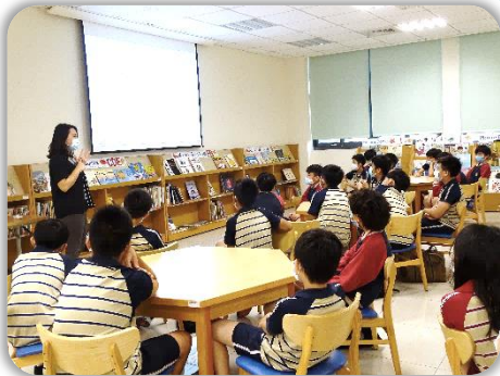
介紹智財權及網路資料的評估。