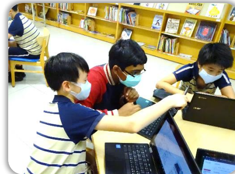
討論看看哪些網站是可信的？